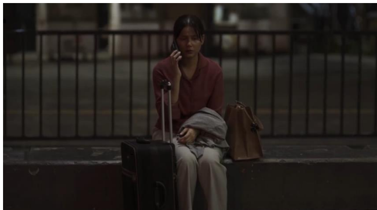
Gambar 5. Menit 1:06:30 Kaluna meninggalkan rumah setelah mengalami konflik dengan keluarganya

Aktualisasi diri merupakan tingkat tertinggi dalam hierarki kebutuhan manusia. Pada tahap ini individu berusaha mengembangkan potensi terbaik dalam dirinya serta mencapai tujuan hidup yang dianggap bermakna.